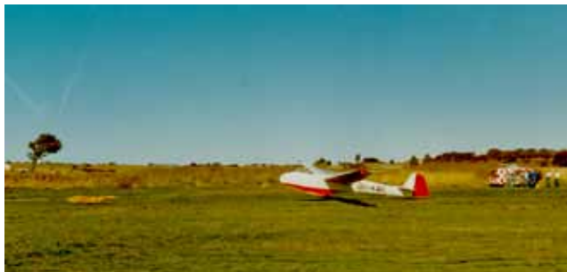
Første solo i 1982...