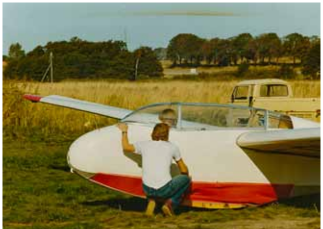
Første solo i 1982...