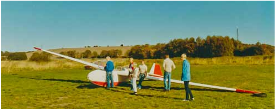
Se lige det kæmpe sideror... Det gav benmuller!