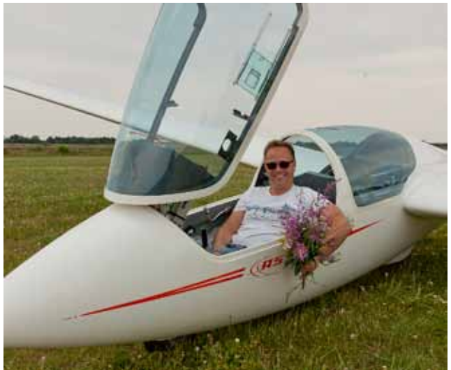
Anden første solo 2011...

I Herning har vi rigtig mange tosædede fly og mange instruktører, der gerne vil flyve med, hvis man skulle have mod på at prøve kræfter med strækflyvningens glæder, men mangler rutinen.