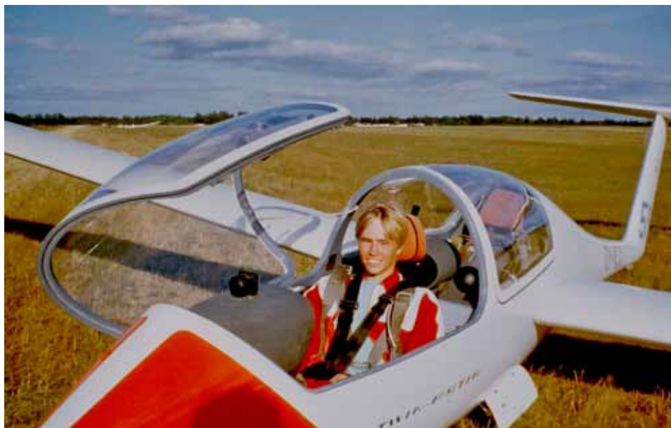
Med Frederikssund Frederiksværks topfly på sommerlejr på Arnborg - 1983...