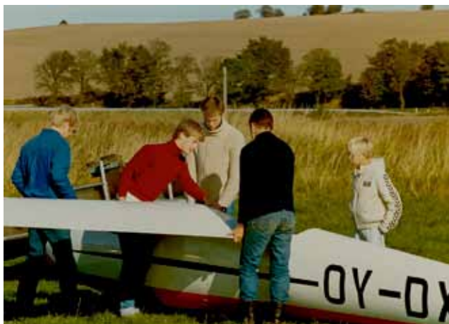
Ka 6E "16" gøres klar til en ny dag...

Da der er søbrise, flyves der rigtig mange starter i løbet af sådan en søndag. Men, det er også vigtigt, at piloten er klar til start lige så snart wirehenteren ankommer med wirerne. Der er skidebatter til dem, der ikke er klar – vi er nemlig alle afhængige af, at det hele spiller, hvis alle elever skal nå at få vores 3 ture á 5 minutter!