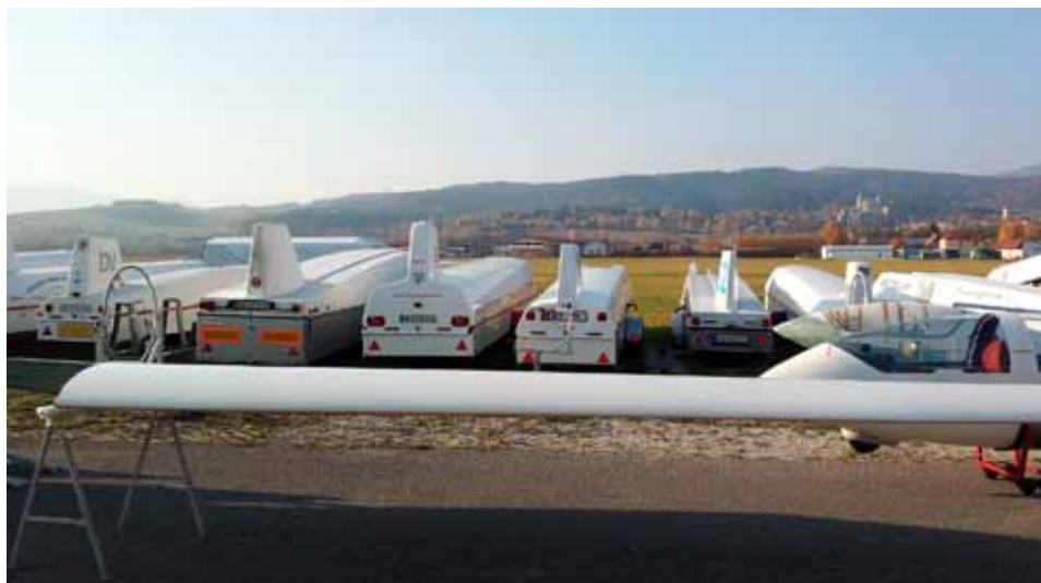
Oplinede transportsvogne, hvor flyene er til overhaling eller reparation...