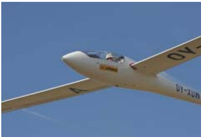
Dansk Nimbus-4 på hjemtærskling...

Gode råd gives – Ingen tvivl om, hvorfor der er så mange som deltager i sådanne konkurrencer.