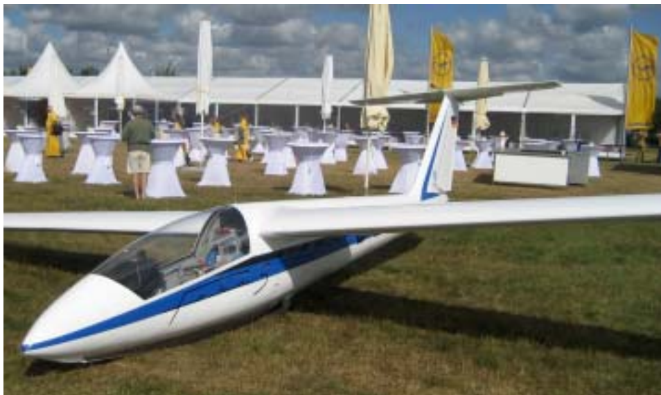
En flot Foka-5 foran Lufthansa's VIP restaurant...

12 slæbefly slæbte de 134 fly op på én time og 30 min. Alt var organiseret til mindst detalje. Det var det spændende, at se de mange nationaliteter. De for rundt omkring flyene for lige at få det sidste ordnet før start.