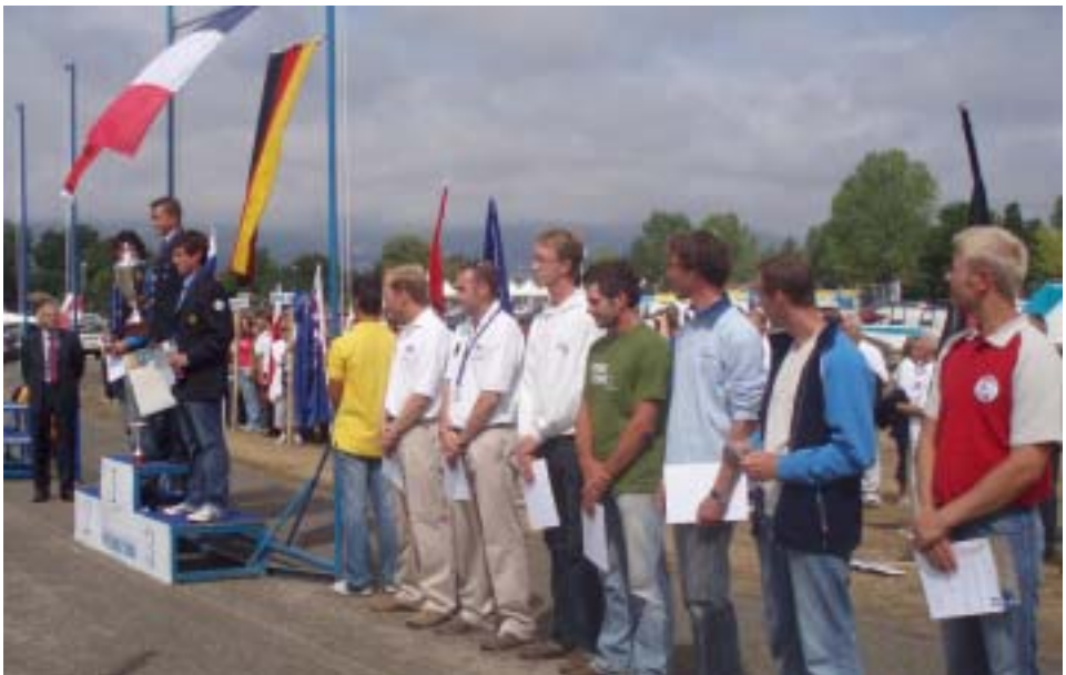
De 10 første i klubklassen...