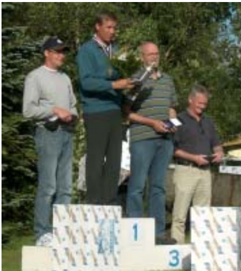
18 meter klassen...