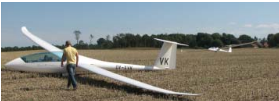
VK er udelandet sammen med en DG-1000... SAC 2006.