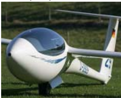
ASG 29... fabriksfoto