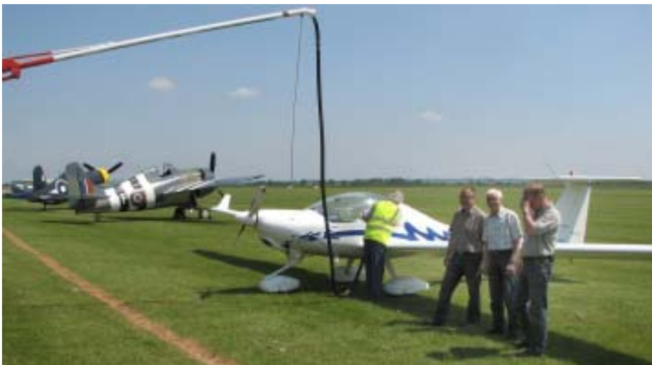
Der tankes... I selskab med en Corsair og en Wildcat!!!!

England og Irland er ikke med i Schengen samarbejdet, hvilket gør papirarbejdet og procedurerne lidt mere besværlige når man skal flyve dertil.