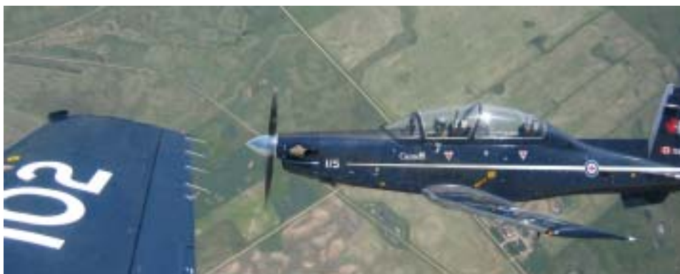
JOB på jobbet...

Check også hjemmesiden: www.banditday.dk (red.;