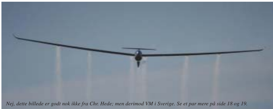
Nej, dette billede er godt nok ikke fra Chr. Hede; men derimod VM i Sverige. Se et par mere på side 18 og 19.