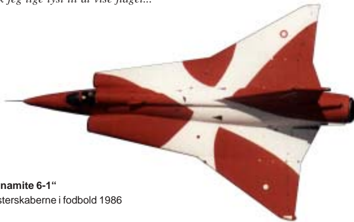
„Danish Dynamite 6-1“