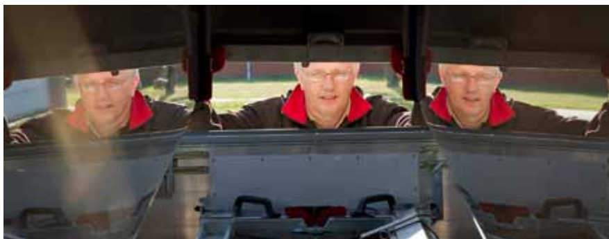
Et sted på Skinderholm...!;) )