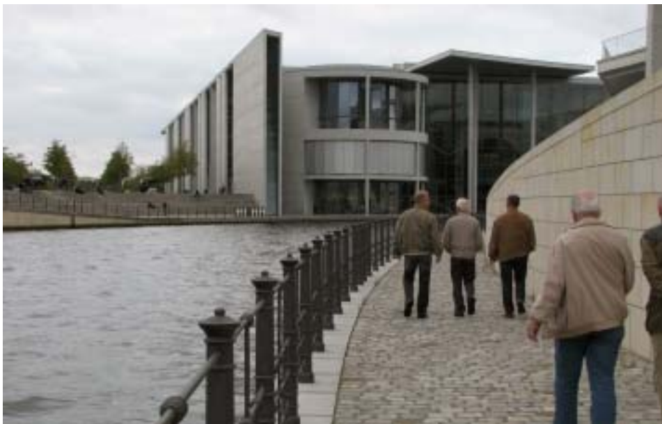
Ved de nye regeringsbygninger i Berlin ...